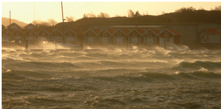
Inte riktigt hur man är van att se havet vid SFS